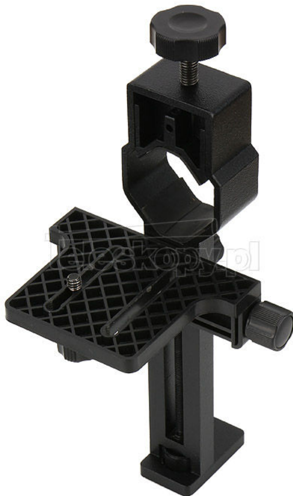
Rys. 1 Aparat kompaktowy oraz adapter do aparatu

Do połączenia aparatu fotograficznego potrzebujesz jedynie uniwersalnego adaptera (Rys. 1, znajdziesz go w sklepie www.teleskopy.pl ). Adapter składa się z półeczki o regulowanym położeniu i śrubie 1/4 cala mocującej aparat oraz regulowanej obejmy, którą przymocujesz adapter do okularu teleskopu.