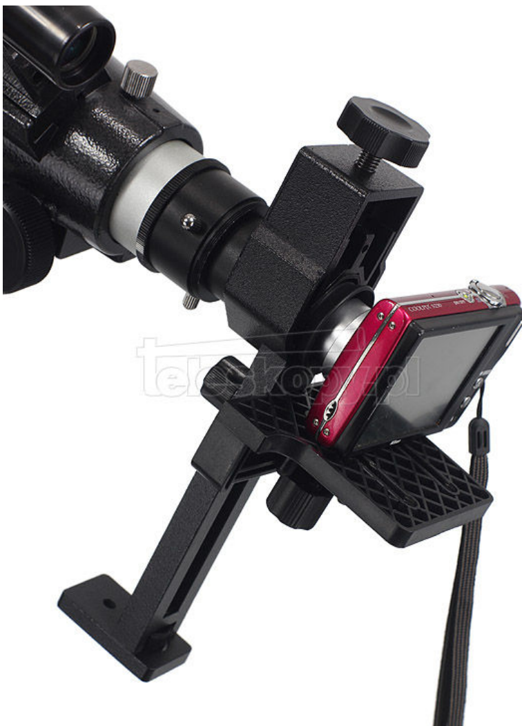
Rys. 2 Aparat kompaktowy zamocowany na półeczce adaptera

Na spodzie aparatu znajdziesz żeńskie gniazdo na śrubę statywową 1/4 cala – przykręć aparat do półeczki, prawidłowo kontrując aparat plastikową nakrętką kontrującą, widoczną na Rys. 2 (zdjęcie po prawej, nakrętka kontrująca widoczna tuż pod półeczką). Następnie korzystając ze śrub regulujących położenie półeczki, przesunij półeczkę z aparatem tak, by obiektyw znajdował się na wysokości środka obejmującej aparat do wyciągu (Rys. 2, zdjęcie po lewej).