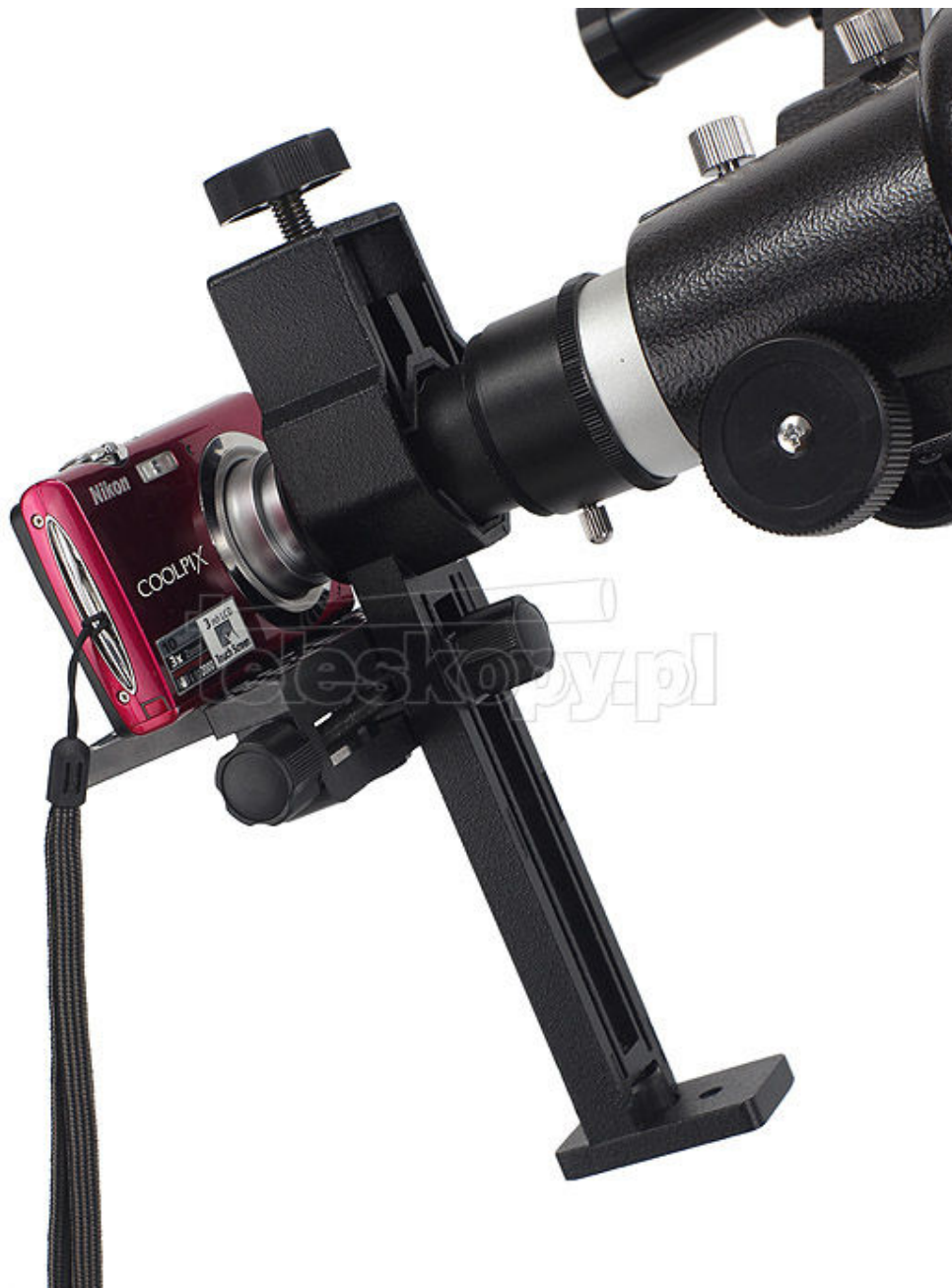
Rys. 3 Adapter z aparatem nakręcony na okular teleskopu

Gotowe! Teraz czas na pierwsze zdjęcie. Pamiętaj jednak, że aby wykonać naprawdę dobre zdjęcie będziesz musiał trochę poeksperymentować, m.in. z odległością aparatu od okularu oraz z ustawieniami opcji aparatu.